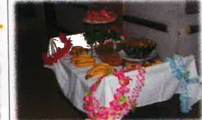
フルーツポンチ(スイカ・バナナ・カン)