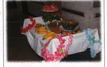
フルーツポンチ(スイカ・バナナ・ミカン)