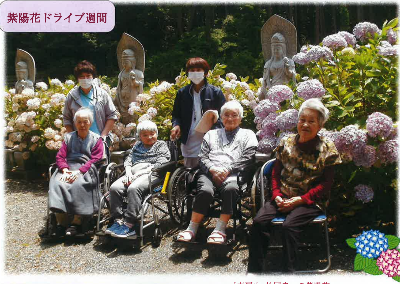
～「南房山 仏国寺」の紫陽花～