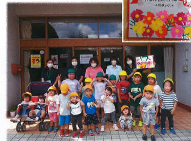
園児の皆さん、ありがとうございました。