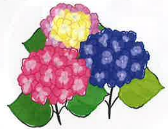
南房山「仏国寺」の観音様と紫陽花