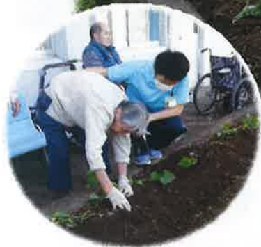
農園クラブでは、ミニトマトやキュウリの収穫、さつま芋の植え付けを行いました。