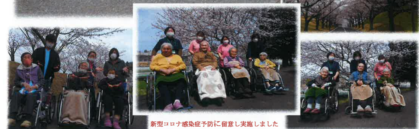
新型コロナ感染症予防に留意し実施しました

日頃より、当施設の事業活動にご支援・ご協力をいただき誠にありがとうございます。昨今の新型コロナウイルス感染症については、全国的に未だ終息には至っておらず、市内及び近隣の発生状況も感染者が発生している状況です。昨年度においても各行事等は、感染予防を徹底し実施してまいりました。段々と暖かくなって桜の季節となりました。天候を見ながらドライブや園外散歩を実施し入所者の皆様に春を感じていただいております。