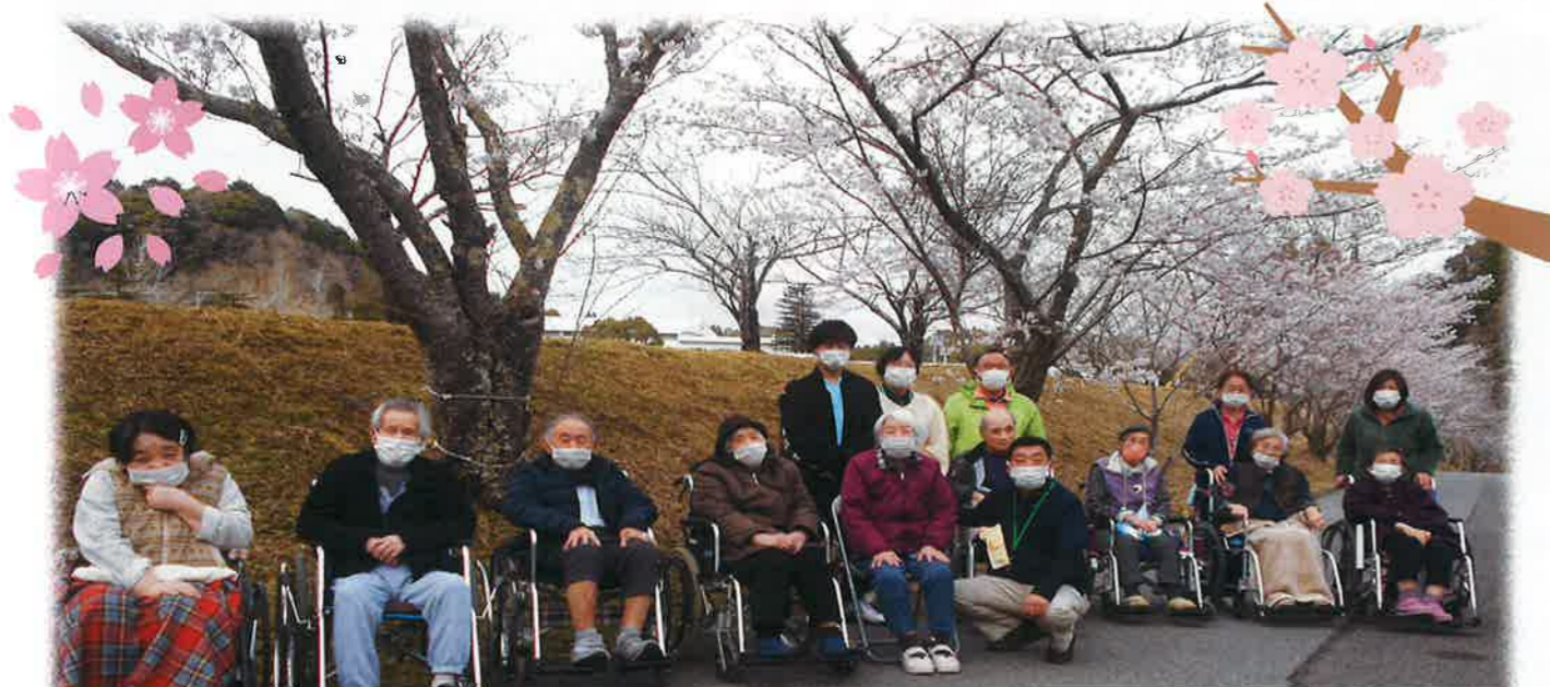
春のお花見週間 (令和4年3月24日～4月6日)